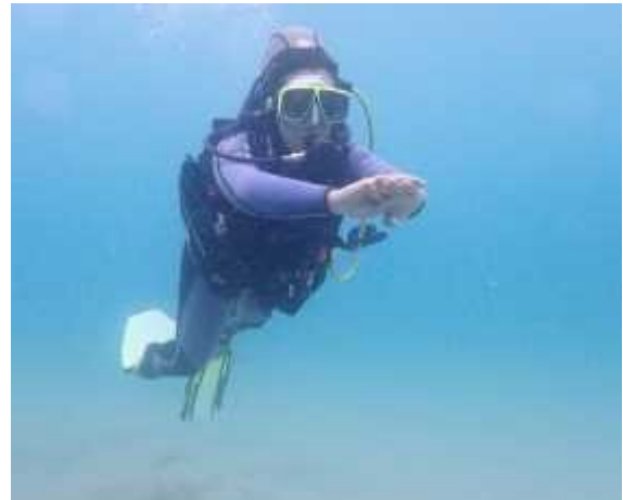
Exercice de Flottabilité avec le gilet