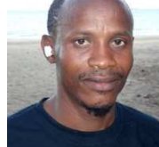
La Force Mohéli