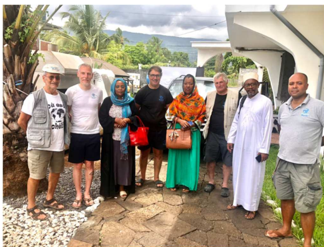
Les responsables du CIR avec les membres de l'équipe de Plongeurs du Monde

Cette mission est dans la continuité du programme initié en 2022 à la demande du CIR (Cadre Intégré Renforcé) et de l'ADSEI (l'Association pour le Développement Socio-Economique d'Itsamia). L'objectif des Comores est de mettre en place un centre de plongée à Itsamia dans le but de favoriser l'éco-tourisme de la région en accueillant de nouveaux touristes plongeurs, pouvoir accueillir des scientifiques marins et sous-marins pour les études des espèces locales et à terme pouvoir dispenser des formations de plongée à la population comorienne.