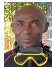
Chioni Grande Comore