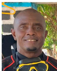
Choukrane Grande Comore